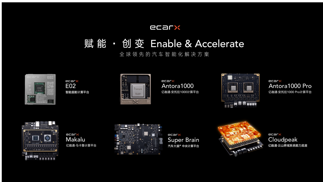
亿咖通科技计算平台

当前文心大模型已经迭代到 3.5 版本，模型效果提升 50%，训练速度提升 2 倍，推理速度提升 30 倍，百度 Apollo 针对车载场景对大模型进行了专项训练和模型精调，探索了包括出行规划、用车顾问、知识问答、灵感绘画等更多场景需求，通过对话式人机交互的代际式革新，满足用户更深层次的车内需求。